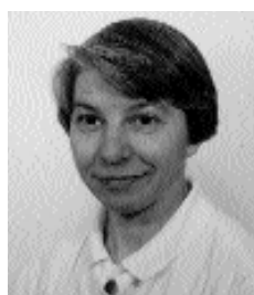
17 Prada Nora di Oscar 03.02.53 Venditrice