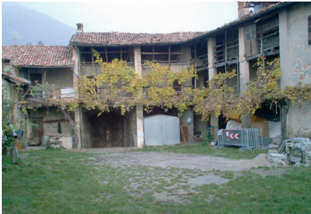
Dopo un travagliato percorso la Masseria Cuntitt sarà ceduta a privati

Dopo questo travagliato percorso la commissione centro civico ha comunque potuto presentare al Municipio, nel marzo del 2006, una sua proposta d'intervento e alcune varianti operative: dalla vendita a promotori privati, al ripristino della struttura con il comune quale promotore. Occorre rilevare che in considerazione della variegata composizione della commissione, la steura di un rapporto d'intervento è sicuramente da considerare come un ottimo risultato. Il rapporto stesso, senza entrare nel merito, è da ritenere di buona qualità. Esso ha fornito al Municipio delle chiare indicazioni di tipo tecnico, economico, procedurale e pianificatorio per le proprie riflessioni. Così da parte sua il Municipio ha potuto individuare una strategia d'intervento e nel novembre 2006 ha definito il futuro della masseria Cuntitt. Eccolo, in sintesi. La struttura sarà ceduta a privati. Il comune metterà dei chiari paletti e vincoli pianificatori. Con essi si obbligherà l'acquirente al rispetto delle esigenze costruttive tipiche di un nucleo storico. All'acquirente sarà anche richiesta la realizzazione di strutture pubbliche