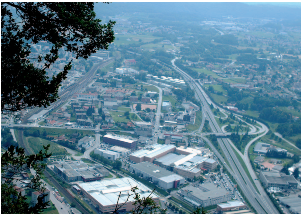
Aggregazioni: negli abitanti di Castello è ancora la parte emotiva a prevalere su quella razionale

Ci troviamo di fronte ad una decisione molto importante per il nostro Comune, dove attualmente la parte emotiva ha il sopravvento su quella razionale e se dovessimo "giocarcela" og-