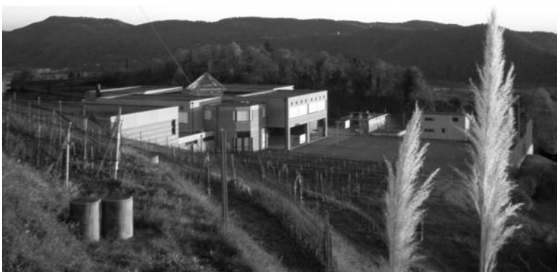
Il Centro scolastico è stato oggetto di una mozione per dotarlo di pannelli solari