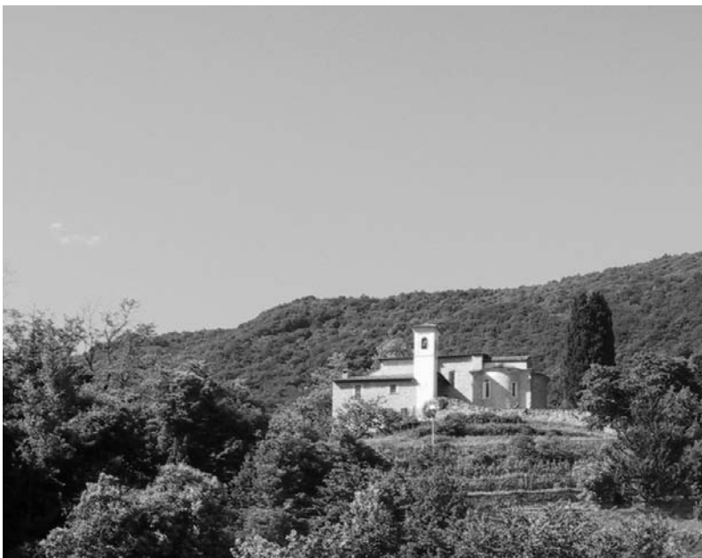
Le vicende parrocchiali non devono in nessun modo interferire con la carica di sindaco

Disapprovo, altresì, l'enfasi giornalistica data all'articolo apparso il 12 giugno sul Corriere del Ticino. Caratteri cubitali, grassetti sui nomi, articolo che occupa parte della sezione della pagina dedicata al Mendrisiotto. Quasi questo fosse un avvenimento paragonabile alla visita di un capo di Stato. Non sono interessato alle vicissi-